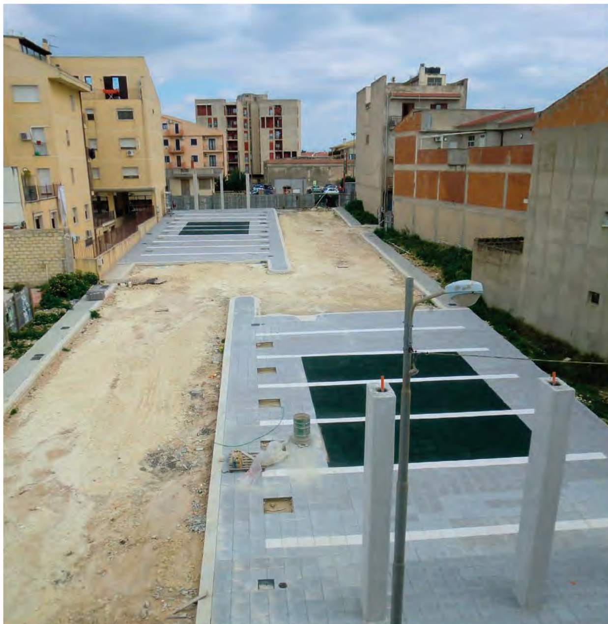
sistemazione area vie: Magenta-Palestro-Terranova