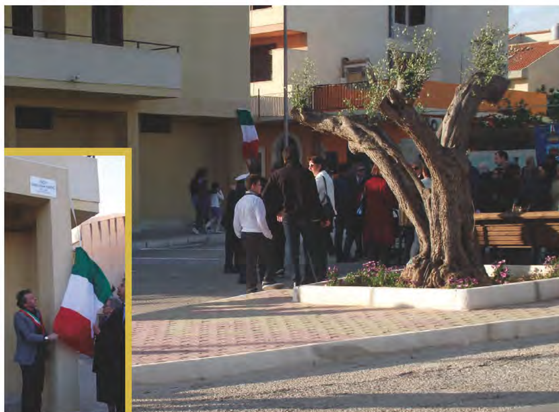
piazzetta Onorina Lenina Fiorentino - Scoglitti; nel riquadro la scoperta della targa