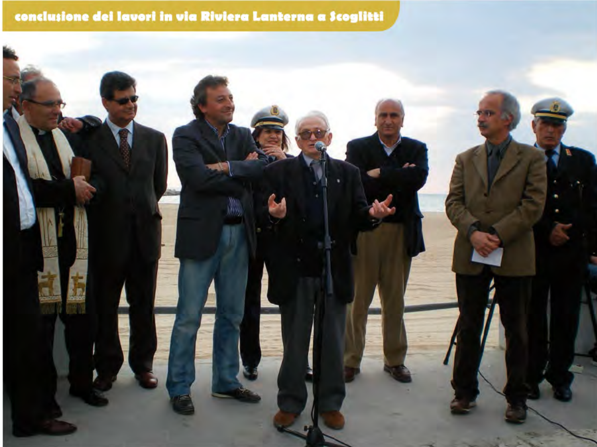
conclusione dei lavori in via Riviera Lanterna a Scoglitti

Per quanto riguarda la viabilità, l'Amministrazione in cinque anni ha avviato un imponente progetto per la pavimentazione e la ripavimentazione delle strade cittadine del centro e delle periferie che soffrivano di decenni di abbandono, reso più grave dai lavori per la metanizzazione. Oltre cento i tratti stradali interessati da manutenzione ordinaria e straordinaria. E' stato anche ripavimentato un ampio tratto della circonvallazione (ex Ss.115).