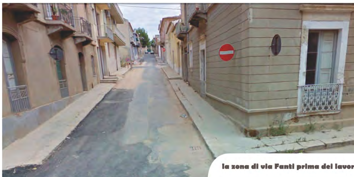
la zona di via Fanti prima dei lavori