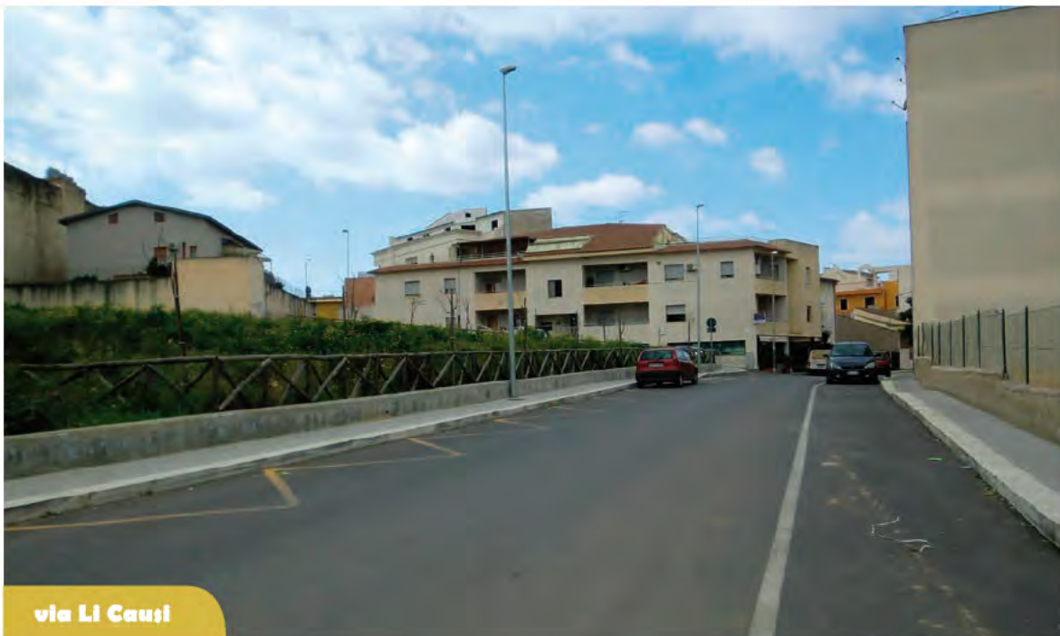
via Li Causi