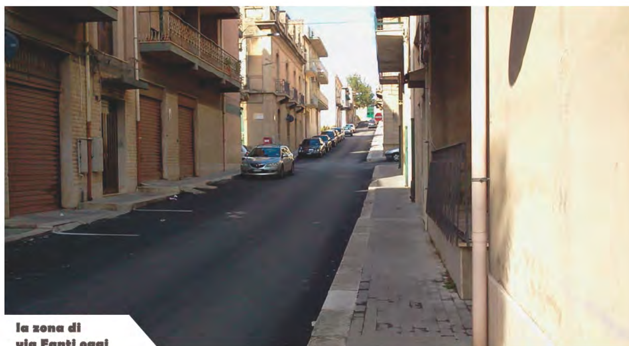
la zona di via Fanti oggi