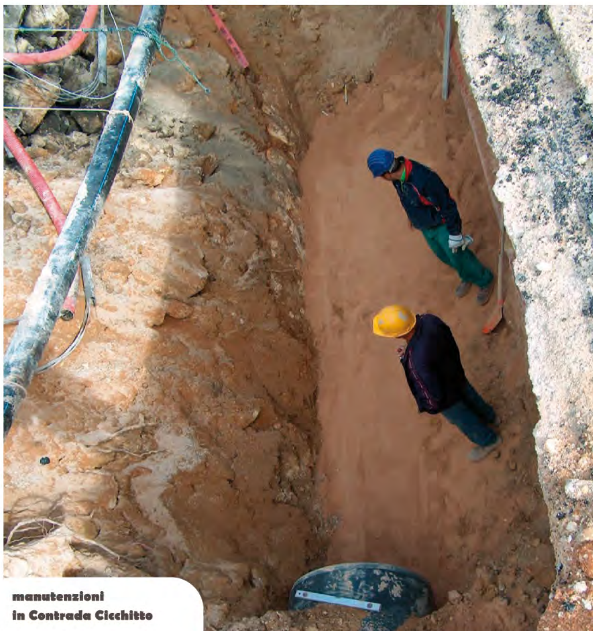
manutenzioni in Contrada Cicchitto

Il settore Manutenzioni, attraverso le sezioni operative, il personale dipendente e il personale giornaliero assunto per le varie esigenze, ha lavorato in questi cinque anni per raggiungere tutti gli obiettivi prefissati dall'amministrazione comunale, per migliorare la qualità della vita dei cittadini, per favorire lo sviluppo socio-economico del territorio e per offrire una immagine quanto più decorosa della Città.